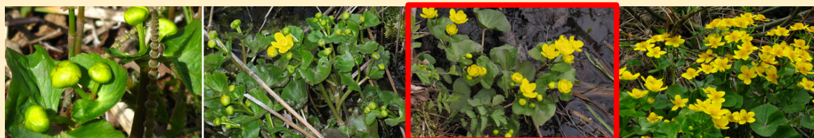
Bild 1. Här visas olika stadier i den fenologiska fasen "Blomning". Stadierna är f.v. "Blomknoppar ännu ej utslagna", "Enstaka blommor utslagna", "Start (minst 10–20 utslagna)" samt "Blommor utslagna".

Blomning startar när 10–20 blommor (kronbladen) öppnats så mycket att du kan se in i blomman. För trädarter är det när 10–20 blommor öppnats inom en individ och för örter är det 10–20 plantor som ska ha börjat blomma. Hos vindpollinerade växter (hassel, björk, al etc.) skakar du hängen och om det 'ryker ut' pollen har dessa börjat blomma; för sälg när du ser gula ståndare eller grönaktiga pistiller i videkissarna.