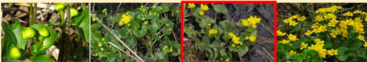
Bild 1. Här visas olika stadier i den fenologiska fasen "Blomning". Stadierna är f.v. "Blomknoppar ännu ej utslagna", "Enstaka blommor utslagna", "Start (minst 10–20 utslagna)" samt "Blommor utslagna".

Blomning startar när 10–20 blommor (kronbladen) öppnats så mycket att du kan se in i blomman. För träarter är det när 10–20 blommor öppnats inom en individ och för örter är det 10–20 plantor som ska ha börjat blomma. Hos vindpollinerade växter (hassel, björk, al etc.) skakar du hängen och om det 'ryker ut' pollen har dessa börjat blomma; för sälg när du ser gula ståndare eller grönaktiga pistiller i videkissarna.