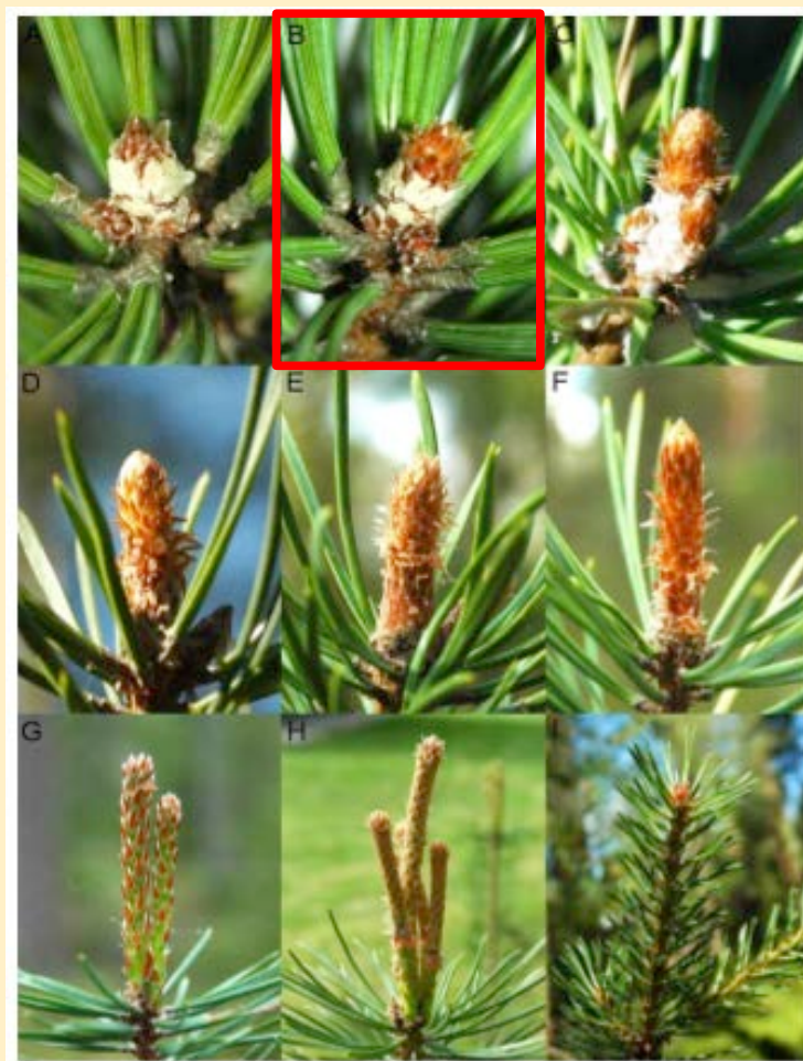
Bild 4. Här visas olika stadier av tallens skottutveckling, där B visar det stadium som vi kallar skottskjutning för tall, d.v.s. då toppknoppen börjar svälla och sträcka på sig, täckfjällen spretar.

Tall startar när toppknoppen börjar svälla och sträcka på sig, täckfjällen spretar (Bild 4B).