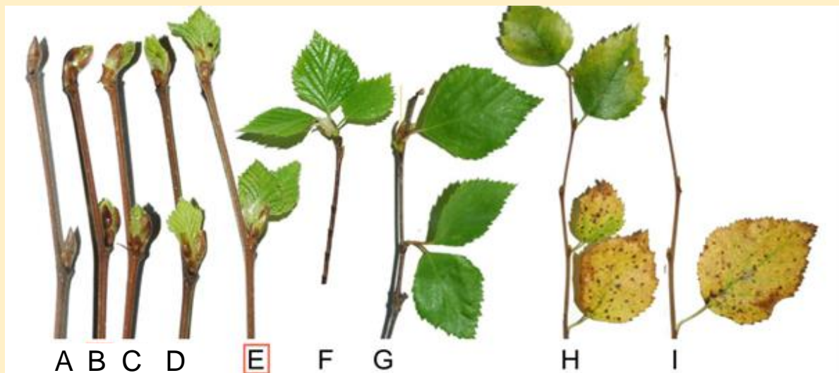
Bild 2. Här visas olika stadier av björkens bladutveckling. Alternativ E visar det stadium som vi kallar lövsprickning; d.v.s. hela bladets form är synlig men ännu inget bladskافت.

Lövsprickning startar när trädet/busken upplevs grönt på avstånd . Om du tittar närmare ska åtminstone hälften av bladen ha kommit ut ur knoppen, men ännu inte utvecklats så långt att bladskافتet är synligt (Bild 2E).